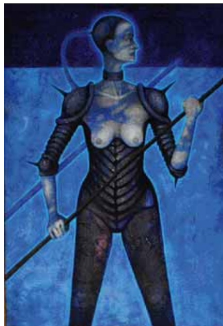
VÁLEČNICE, 2003, olej na plátně, 100 x 80 cm, 64 000 Kč