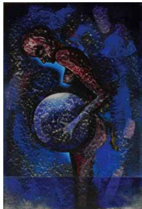
PERLORODKA, 2010, olej na papíře, 65 x 44 cm, 64 000 Kč