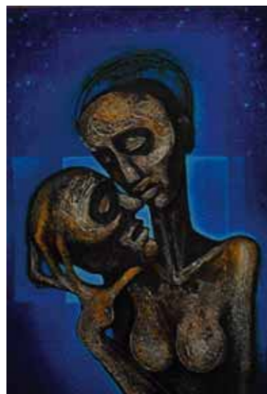
HVĚZDNÁ SALOME, 2009, olej na papíře, 65 x 44 cm, 64 000 Kč