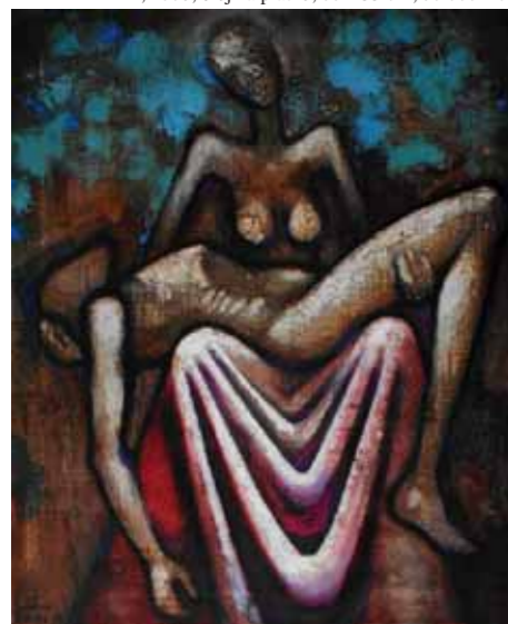
MALÁ PIETA, 2008, olej na plátně, 66 x 55 cm, 70 000 Kč

Němec a přiznává, že v něm vždycky bojovala ta „jírovská“ exprese s precizností dokonalého technika, jakým byl jeho otec. „Moje rané obrazy byly vždycky o tom, že jsem stavěl do kontrastu velmi volnou malbu s nějakým až hyperrealistickým detailem.“ Z posledních obrazů je patrné, že se tyto dva přístupy k malbě vyrovnávají. Vypovídá o tom obraz Velká pieta , na kterém pracoval s přestávkami celý uplynulý rok. V poslední době se stále častěji ze svého malostranského bytu vydává směrem k vlnohradskému ateliéru. Říká, že by se rád nechal malířstvím zcela pohltit. Pro příznivce výtvarného umění je to dobrá zpráva, ale věřte muzikantovi.