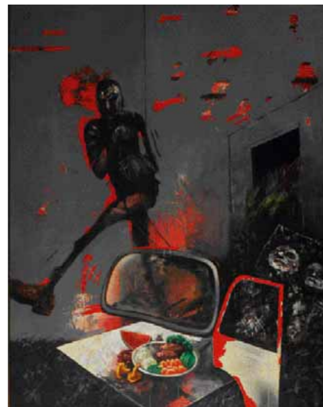
TICHÁ NOC, 1996, olej na plátně, 150 x 122 cm, 185 000 Kč