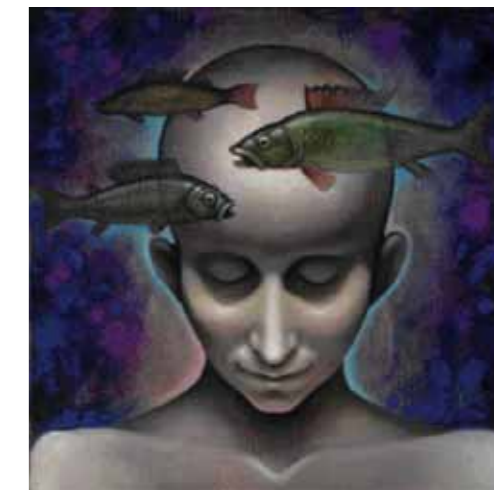
SEN, 2010, olej na plátně, 40 x 40 cm, 58 000 Kč

Naštěstí se dostal do ateliéru Jana Smetany, tolerantního člověka a vzdělaného estéta, člena skupiny 42, která je dodnes inspirující. První obrázek, ukřižovaného Ježíše, ale namaloval ještě v předškolním věku. Jak vzpomíná, tenkrát byl od barev více umazaný jeho otec, jak se ho snažil zachránit. „Táta byl výborný malíř, ale rozhodl se tak trochu obětovat malování profesi restaurátora, aby zaopatřil rodinu. Byl velký kamarád Josefa Jíry, který byl jeho protipólem. Pepík Jíra byl bohém, všechny kolem podřídil svému egu, a možná i díky tomu vytvořil výjimečné dílo. V jeho ateliéru jsem jako kluk byl více než doma a samozřejmě byl mým hrdinou. Dneska vím, že tím hrdinou byl asi spíš táta. No, ale tenkrát to byl Josef, vonící terpentýnem a červeným vínem. Měli jsme na Malé Skále chalupy blízko sebe, tak jsem skočil na kolo a za chvíli mu stál za zadkem u rozmalovaného plátna. Naučil mě v Jizeře lovit pstruhy ‚na mušku‘ a obdařoval mě radami, jaké člověk na školách nepochytí. To víte, radit mladému klukovi, aby nemaloval oblohu modrou barvou, nebo aby si k modelu sedal zády – to si žádný pedagog netroufnil,“ vzpomíná Martin