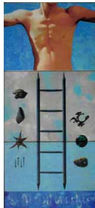
ES IST VOLL BRACHT, 2002, olej na plátně, 166 x 75 cm, 155 000 Kč