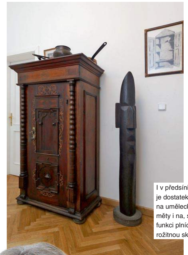
I v předsíni – hale je dostatek místa na umělecké předměty i na, svoji funkci plnící, starožitnou skříň.