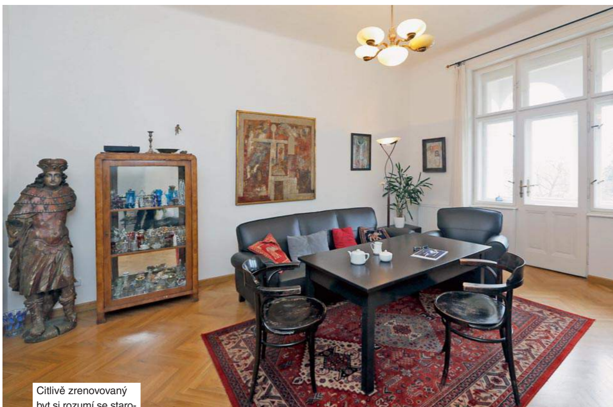
Citlivě zrenovovaný byt si rozumí se starožitnými solitéry i současným nábytkem.