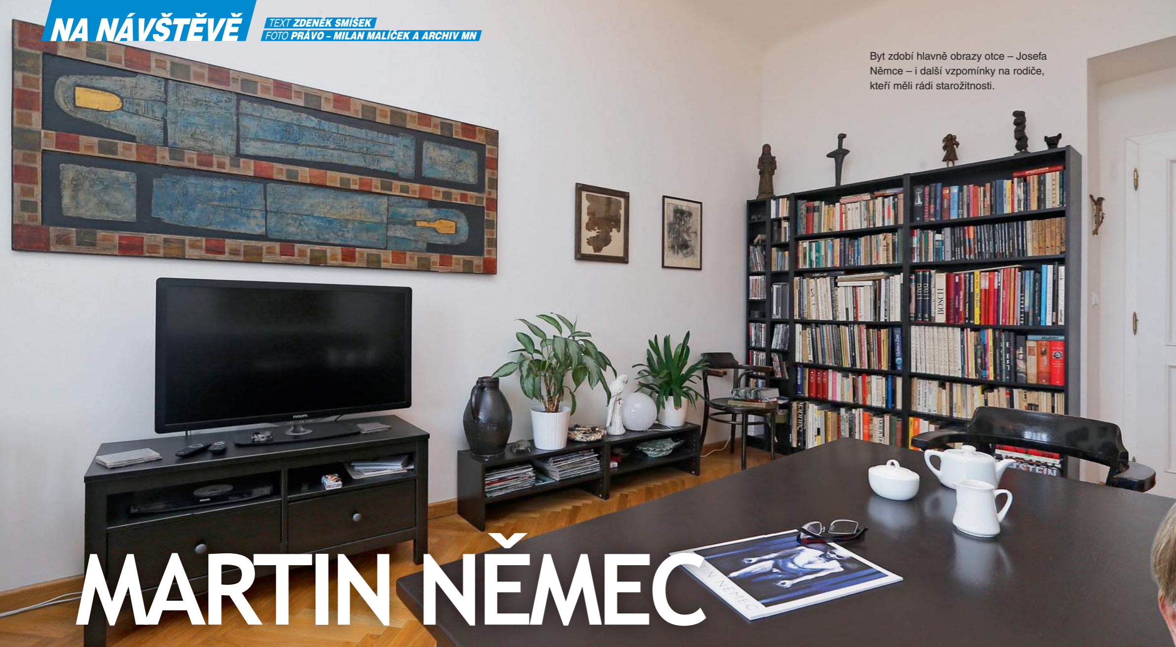
Byt zdobí hlavně obrazy otce – Josefa Němce – i další vzpomínky na rodiče, kteří měli rádi starožitnosti.