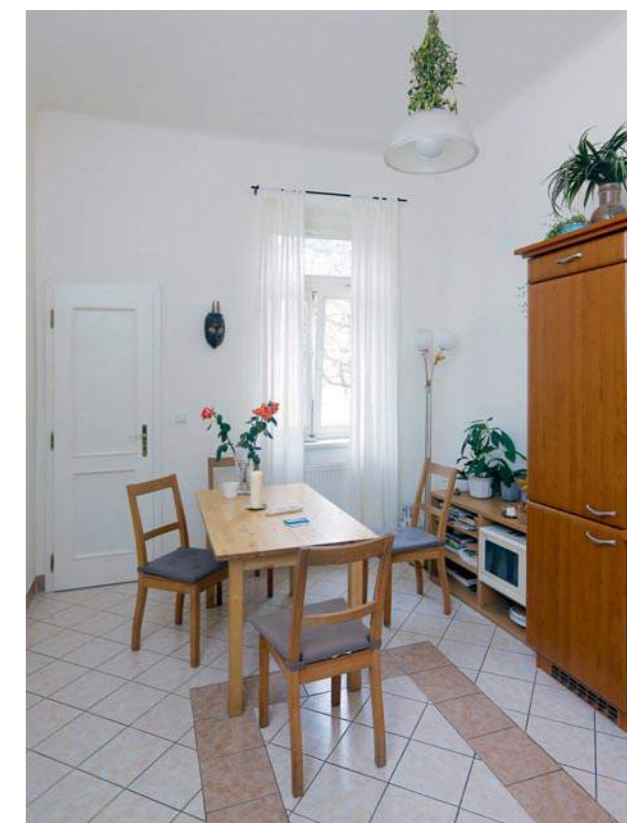
I kuchyň je prostorná a světlá místnost s vysokými stropy.