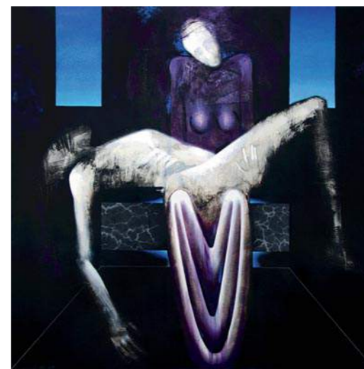
Velká pieta, olej na plátně, 145x145 cm, 2010