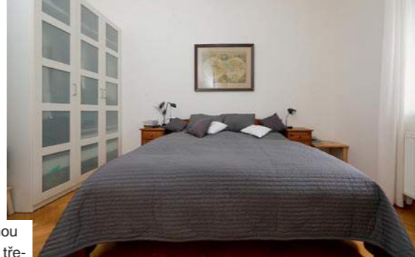
V ložnici nyní mohou mít otevřené okno třeba celou noc a ticho je i nad ránem!